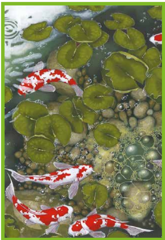
ill. Virginie Rapiat