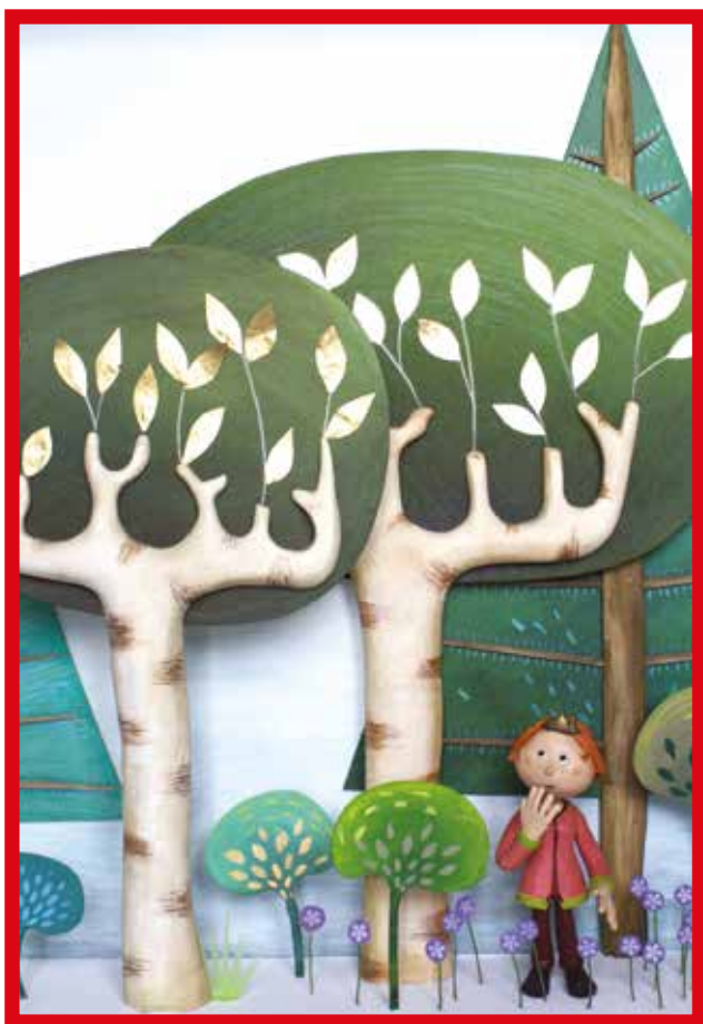
détail de décor réalisé par Samuel Ribeyron pour Le printemps de Mélie