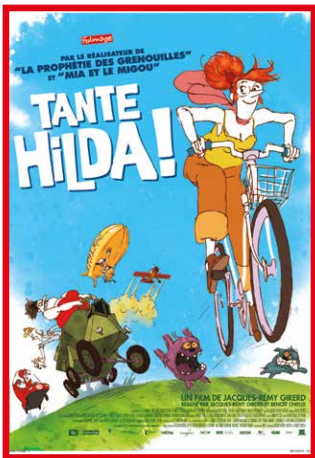
affiche du film Tante Hilda