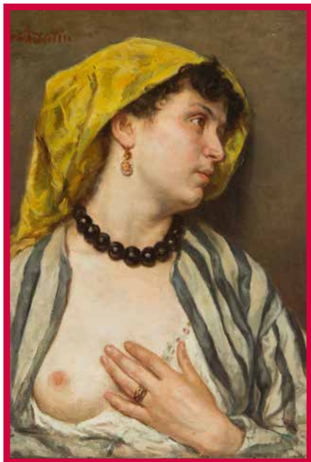
Marcellin Desboutin, Florentine au sein nu , 1865, coll. particulière