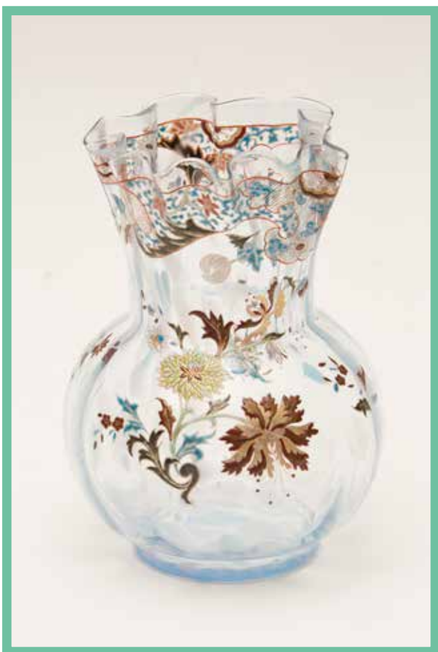
Émile Gallé, Vase à décor floral, vers 1880, coll. Mab