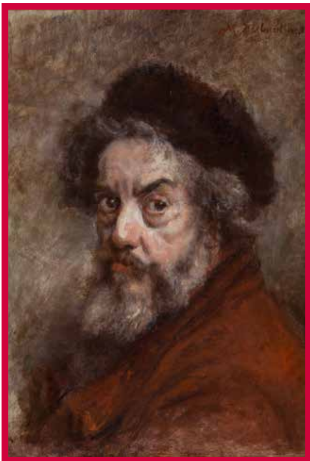
Marcellin Desboutin, Autoportrait , 1896, coll. Mab

Un riche programme culturel (visites, conférences, concerts...), ainsi qu'un ouvrage réalisé avec les éditions Faton, prolongent l'exposition.