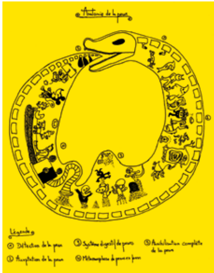
Œuvre de Lucas, ed. Gallimard Jeunesse, 2012 © Envois d'Enfance