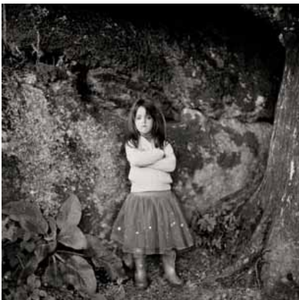
La gardienne, Isabelle Vaillant, ed. Gallimard Jeunesse, 2012