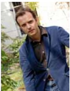
tous droits réservés

Timothée de Fombelle est né en 1973. D'abord professeur de lettres, il se tourne tôt vers le théâtre. En 1990, il crée une troupe pour laquelle il écrit des pièces qu'il mettra lui-même en scène. Depuis, il n'a cessé d'écrire pour le théâtre.