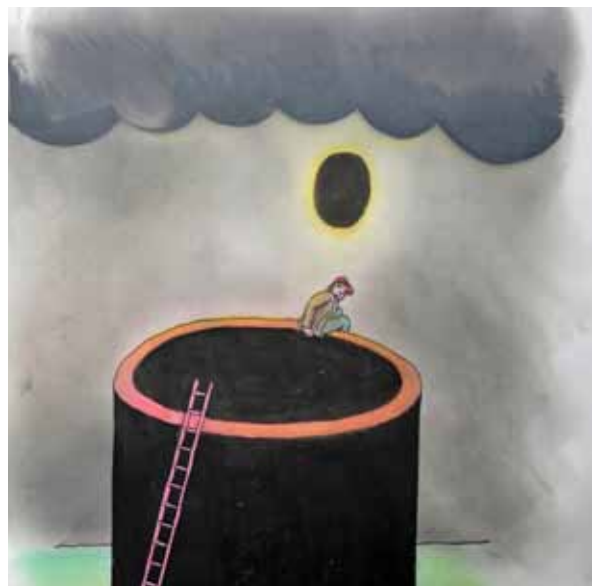
Peur de la vie, Tomi Ungerer, ed. Gallimard Jeunesse, 2012