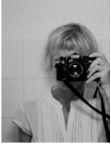
tous droits réservés