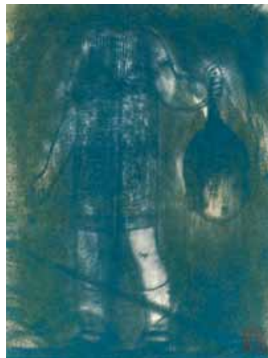
Résurgence, Rascal, ed. Gallimard Jeunesse, 2012