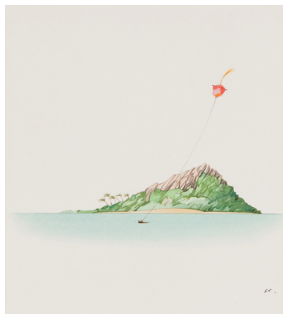
Illustration de Georges Lemoine Vendredi ou la vie sauvage , texte de Michel Tournier, Gallimard, Folio Junior, 1977, aquarelle sur papier d'Arches LLF, coll. mij.